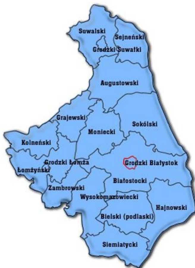
Rysunek 1. Lokalizacja miasta Białystok na tle podziału administracyjnego województwa podlaskiego

Program opracowano dla aglomeracji białostockiej, która zlokalizowana jest w północno-wschodniej Polsce. Poniżej przedstawiono lokalizację miasta Białystok na tle podziału administracyjnego województwa podlaskiego.