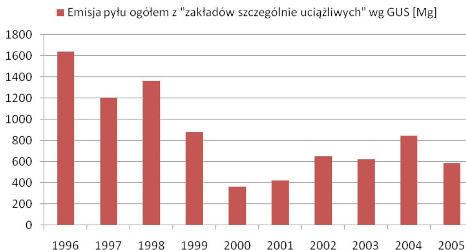
Rysunek 2. Emisja pyłu ogółem z zakładów szczególnie uciążliwych na terenie miasta Białystok.

Według danych GUS od 1996 do 2000 roku obserwowany był silny spadek „emisji zanieczyszczeń pyłowych z zakładów szczególnie uciążliwych” (brak danych o ilości i rodzaju zakładów poddanych badaniu statystycznemu), co związane było z przemianami gospodarczymi zachodzącymi w kraju. W latach 2001 -2004 obserwowany był niewielki wzrost emisji zanieczyszczeń pyłowych, a następnie spadek w 2005 roku. Emisja zanieczyszczeń pyłowych w 2005 roku z zakładów szczególnie uciążliwych wynosiła wg GUS 590 Mg.