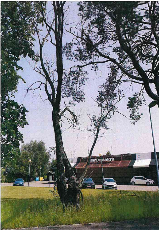
Al. JANA PAWŁA II dz. nr 87/3 obr. 4