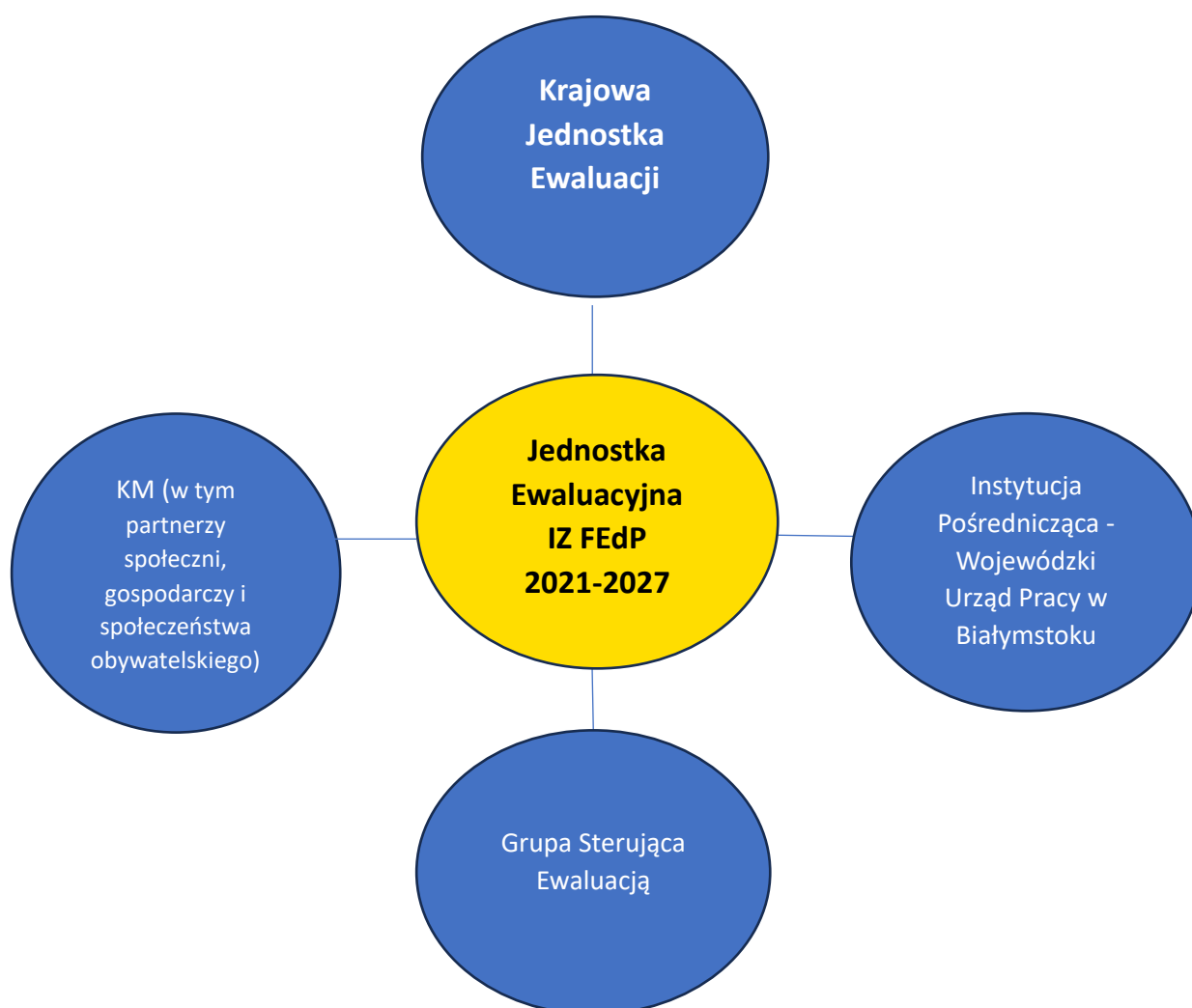
Wykres 2. Podmioty zaangażowane w proces ewaluacji FE dP 2021-2027