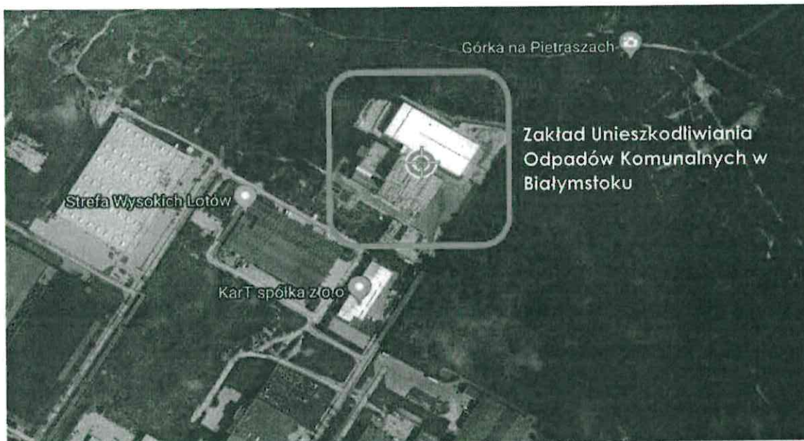
Rys. 1. Lokalizacja instalacji IPPC stanowiącej przedmiot operatu pożarowego.

Terytorialnie i operacyjnie Zakładu Unieszkodliwiania Odpadów Komunalnych w Białymstoku podlega pod Jednostkę Ratowniczo-Gaśniczą Nr 2 Komendy Miejskiej Państwowej Straży Pożarnej w Białymstoku, która zlokalizowana jest przy ul. Generała Władysława Andersa 46.