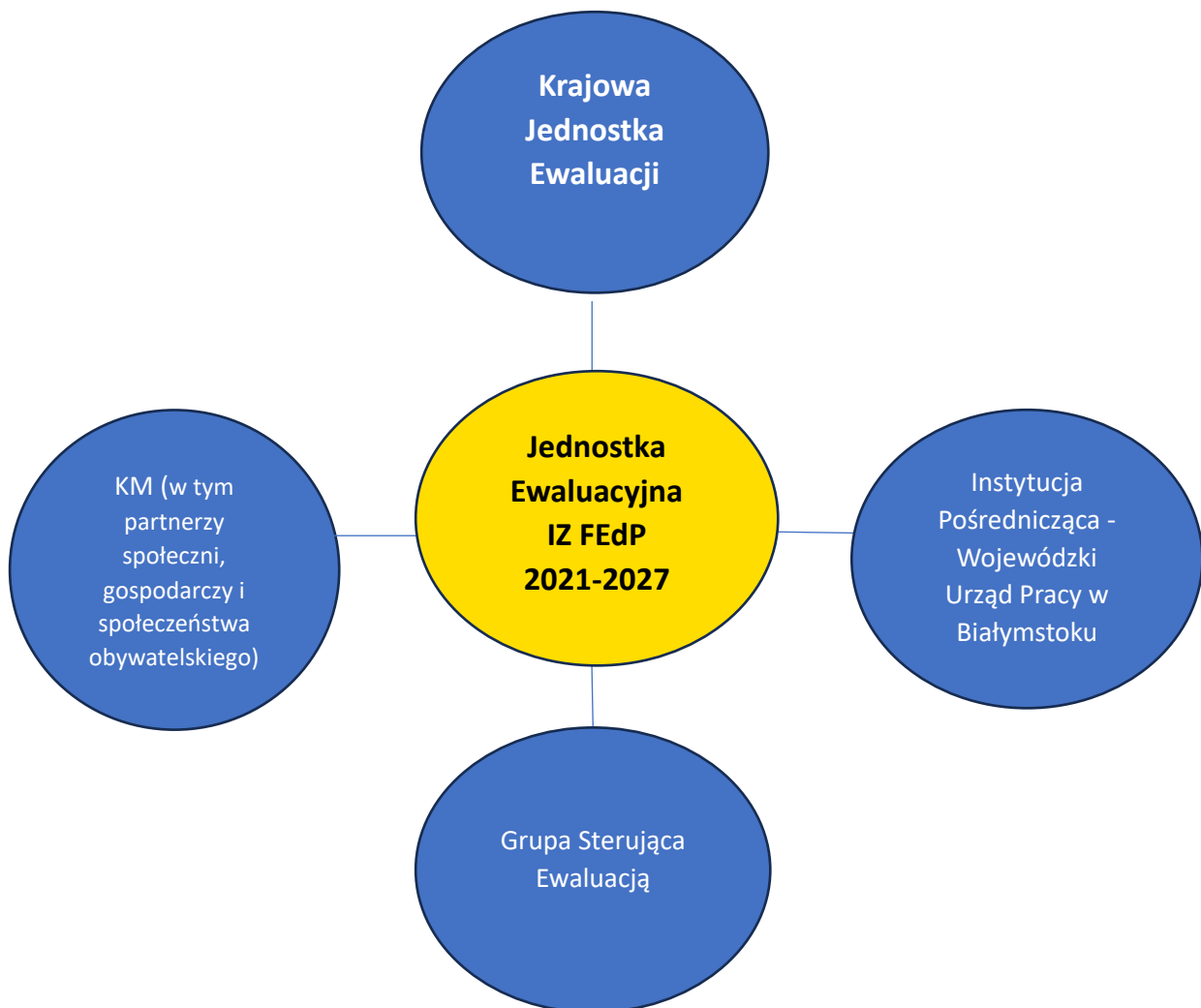
Wykres 2. Podmioty zaangażowane w proces ewaluacji FE dP 2021-2027