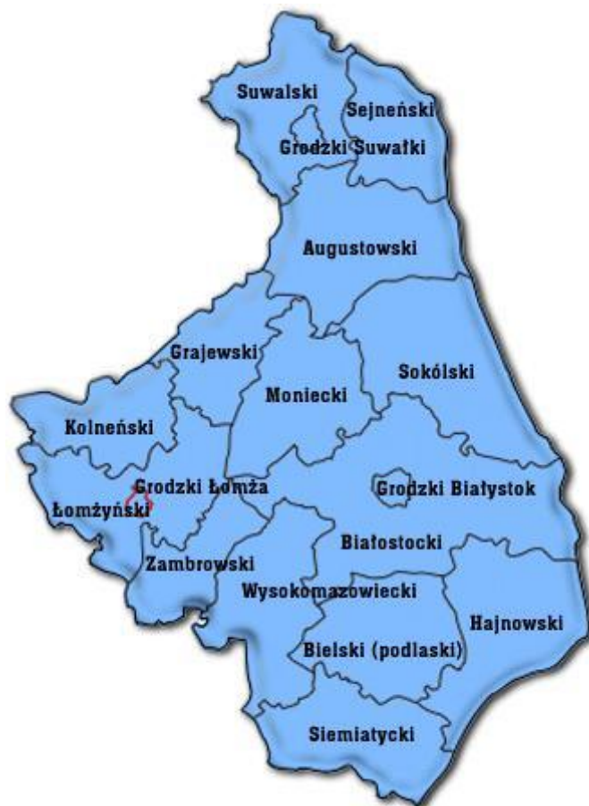
Rysunek 1. Lokalizacja miasta Łomży na tle podziału administracyjnego województwa podlaskiego

Program opracowano dla miasta Łomży, które zlokalizowane jest w północno-wschodniej Polsce, w zachodniej części województwa podlaskiego. Poniżej przedstawiono lokalizację miasta Łomży na tle podziału administracyjnego województwa podlaskiego.