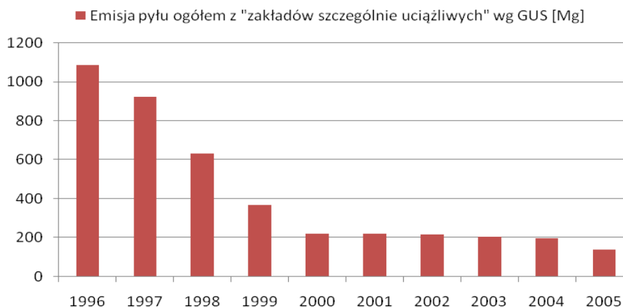
Rysunek 2. Emisja pyłu ogółem z zakładów szczególnie uciążliwych na terenie miasta Łomży.

Według danych GUS od 1996 do 2000 roku obserwowany był silny spadek „emisji zanieczyszczeń pyłowych z zakładów szczególnie uciążliwych” (brak danych o ilości i rodzaju zakładów poddanych badaniu statystycznemu), co związane było z przemianami gospodarczymi zachodzącymi w kraju. W latach 2001 -2005 obserwowano również spadek wielkości emisji zanieczyszczeń pyłowych, jednakże znacznie mniejszy. Emisja zanieczyszczeń pyłowych w 2005 roku z zakładów szczególnie uciążliwych wynosiła wg GUS 138 Mg.